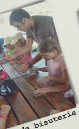
... de bisutería