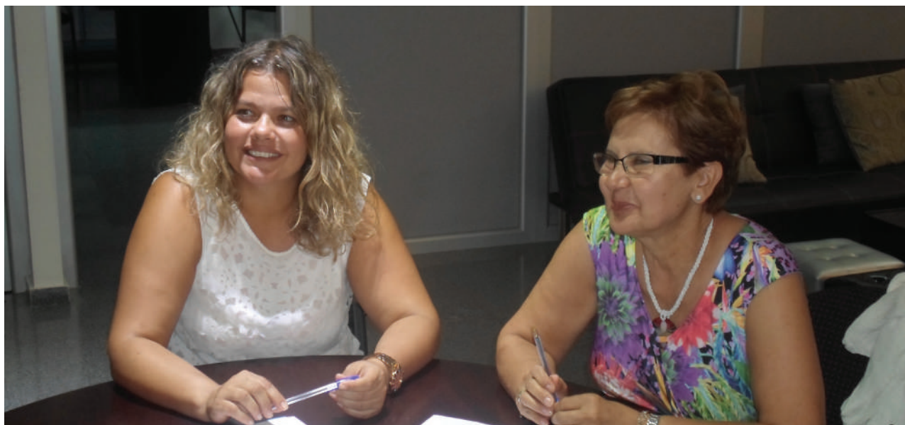
Vicedecana del Colegio de Psicólogos y la vicepresidenta de la AVT.