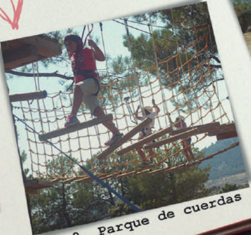
Día 9. Parque de cuerdas