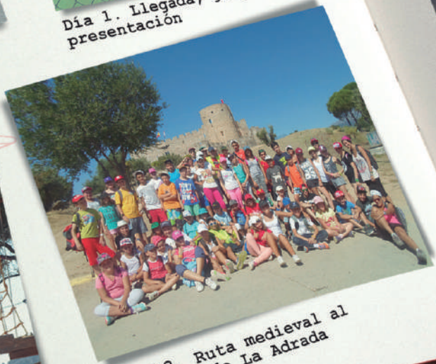
Día 13. Ruta medieval al Castillo de La Adrada