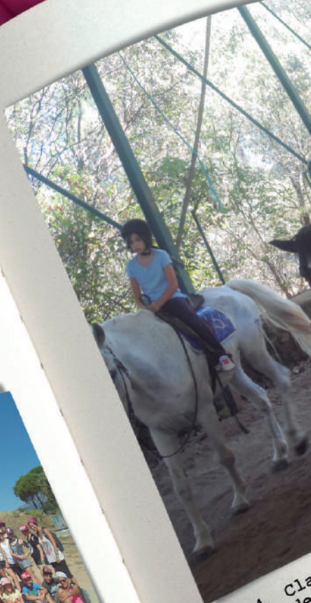
Día 4. Cla... y doma de...