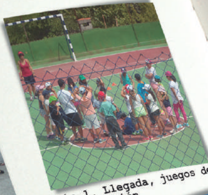
Día 1. Llegada, juegos de presentación