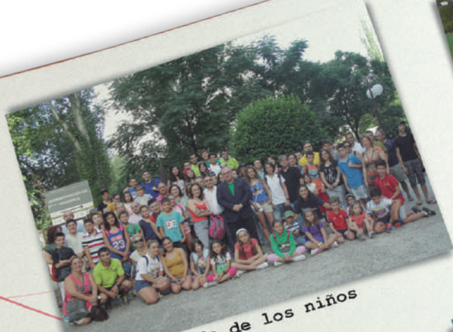
Día 1. Salida de los niños desde la sede