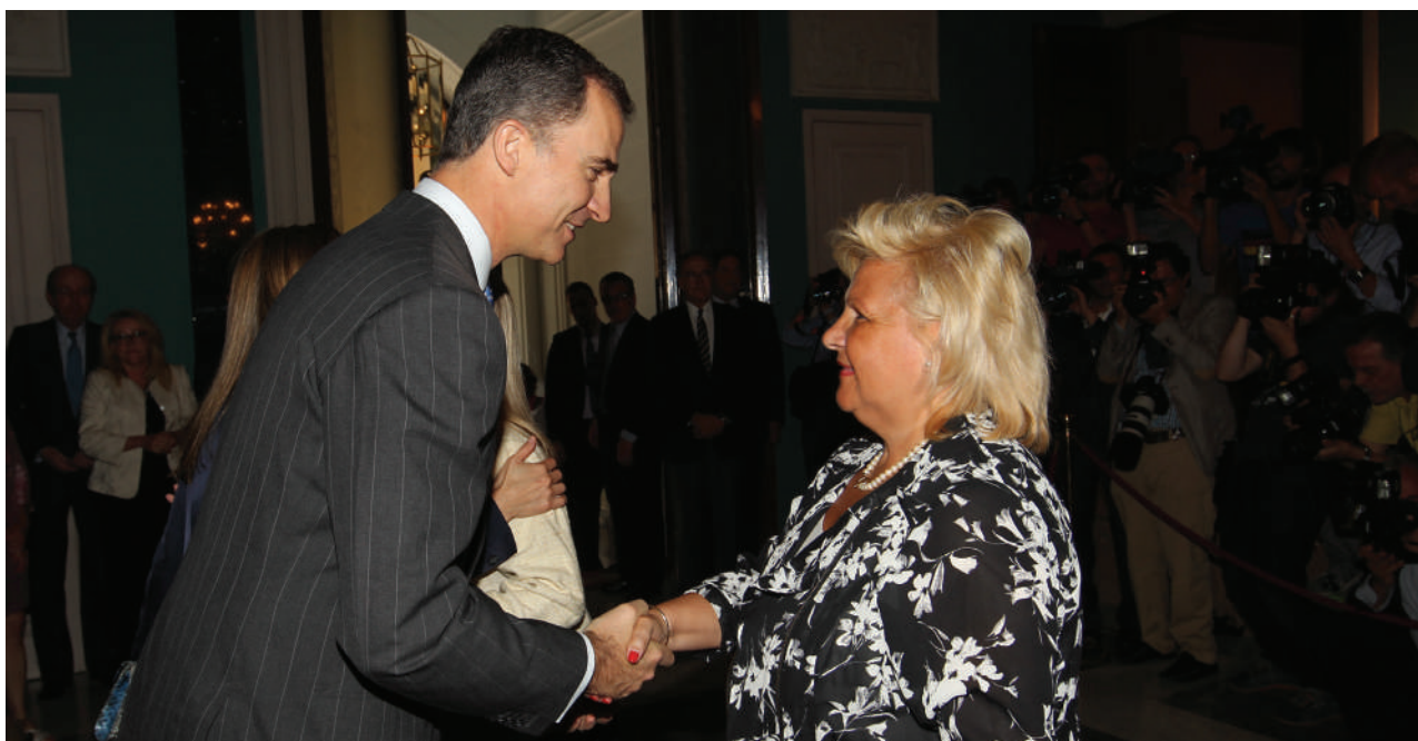
Recepción SS.MM. Los Reyes España

Para finalizar el mes, el día 28, la junta directiva de la Asociación y sus delegados se dieron cita en Madrid para revisar el desarrollo