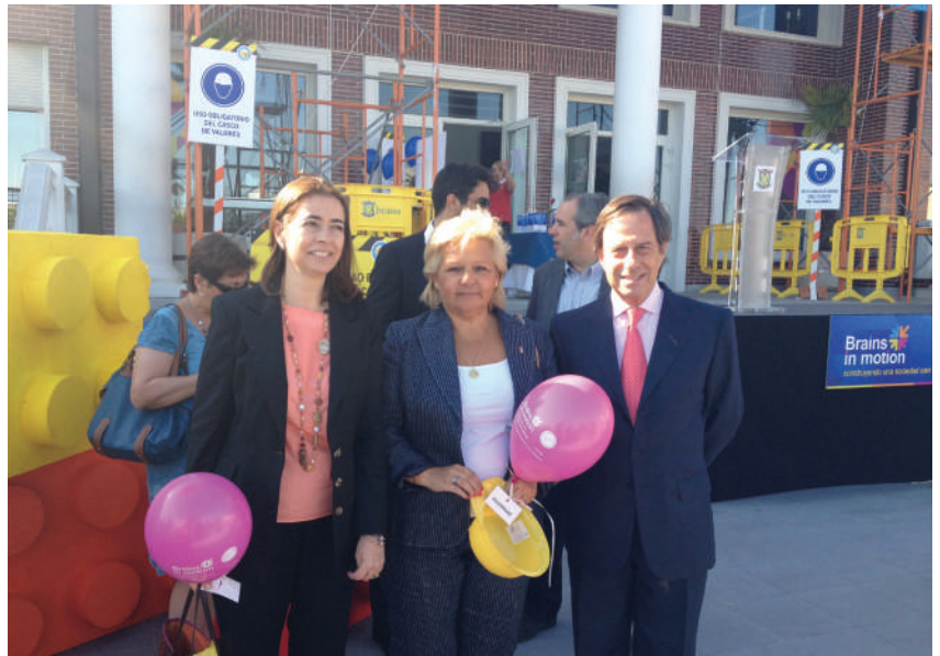
Colegio Brains de Madrid.