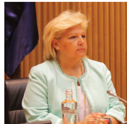
Homenaje a las Víctimas en el Congreso.

de las actividades desde el inicio de la nueva legislatura y programar las de los próximos meses.