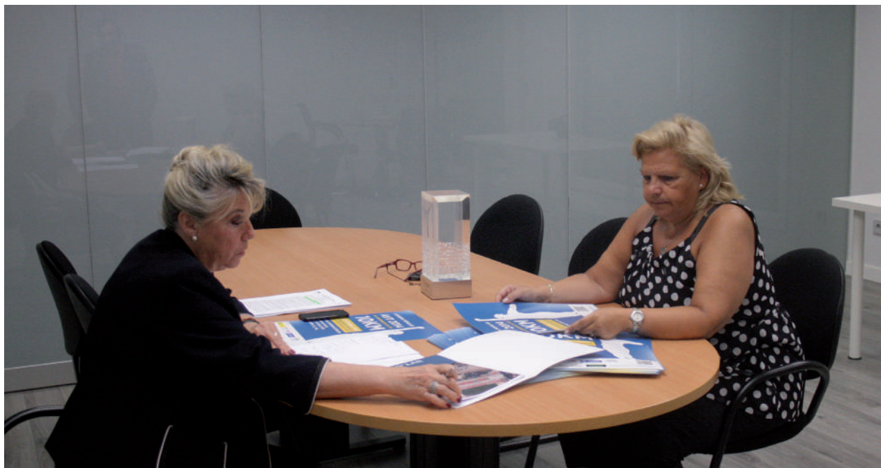
Reunión con la Concejala de distrito de Moratalaz